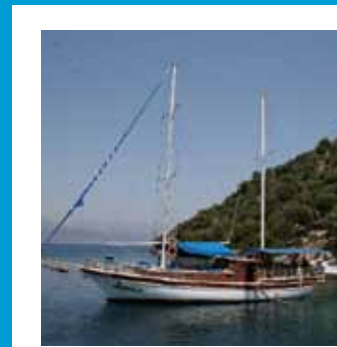
Zeileruise in Turkije