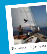
De wind in je haren...